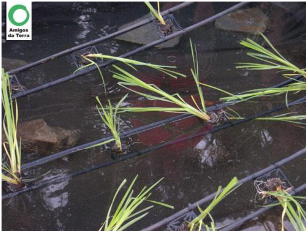
Detalle de macrofitas ya instaladas en flotación sobre la lámina de Agua