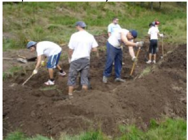
Excavaciones día 3 de agosto, acopio de arena en taludes y nivelado.