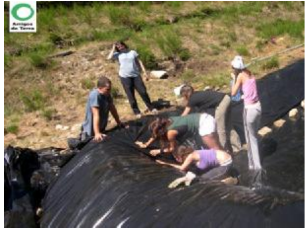
Fijación de base y laterales