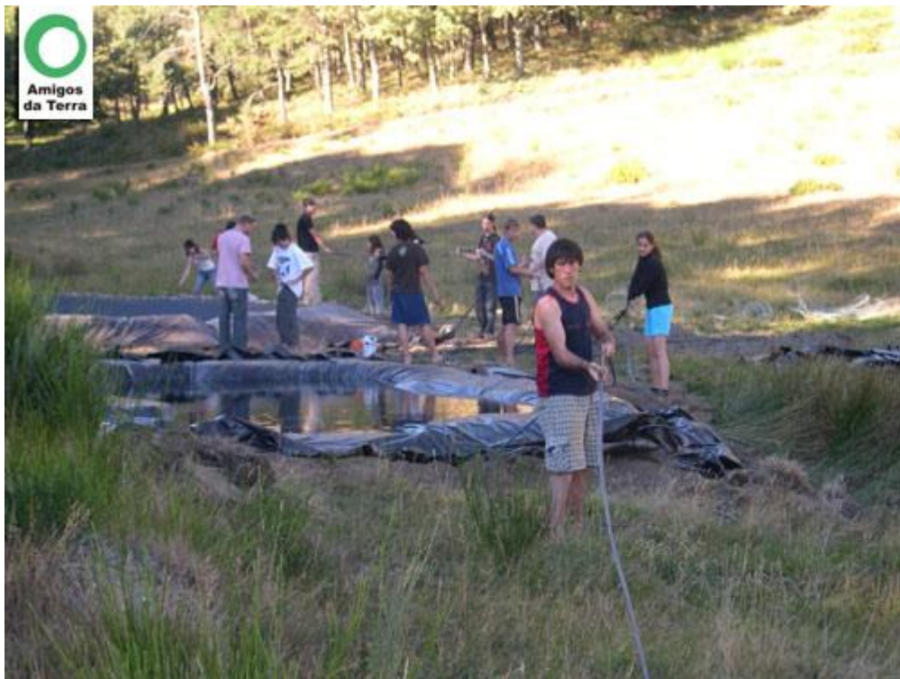
Detalles de la segunda balsa de rebombeo