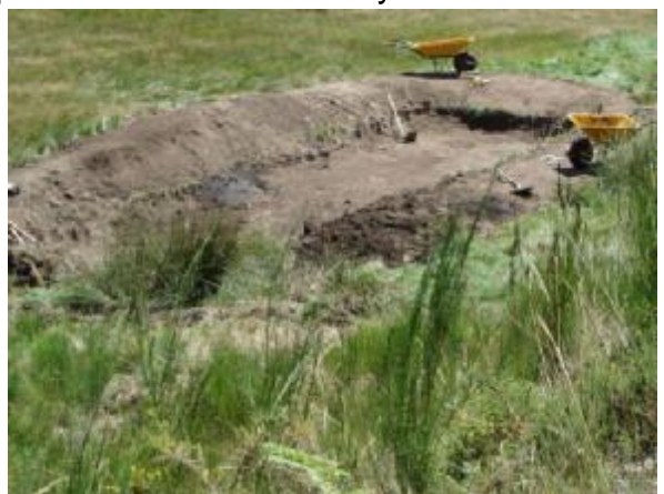
Final día 3 de Agosto