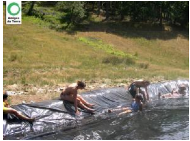
Fin de los trabajos de impermeabilización, y actividades recreativas sobre la misma.