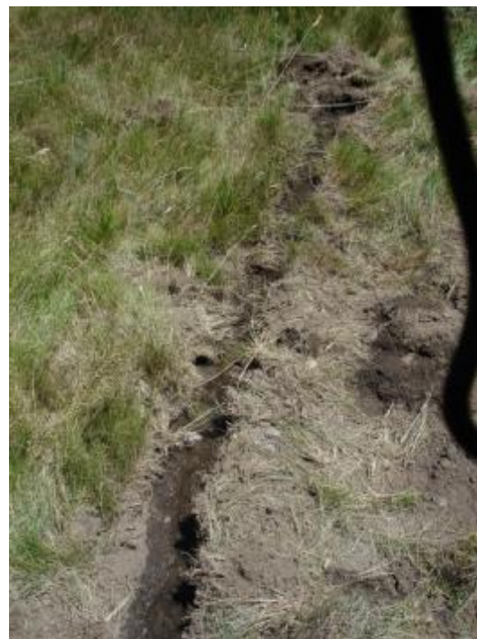
Zanja de desvío del Efluente de Salida de Fosa Séptica para evitar encharcamientos en la zona de excavación