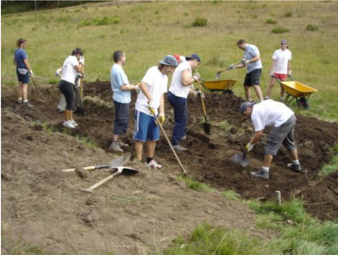
Comienzo de las excavaciones - 2 de Agosto