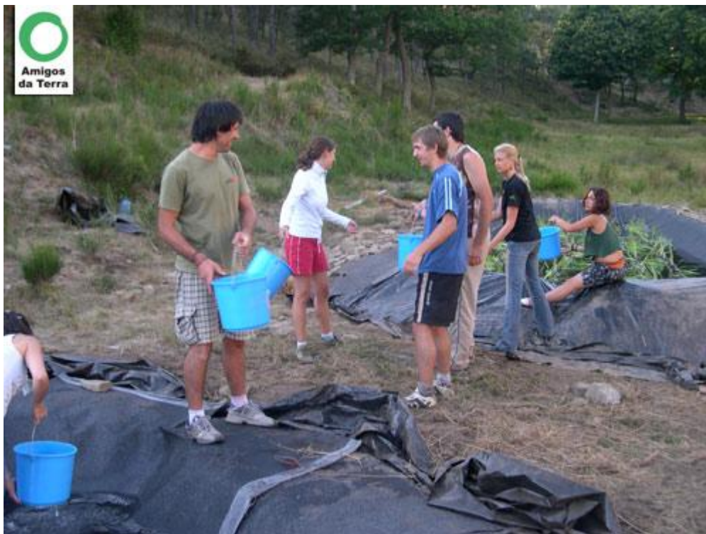
Llenado de balsas con agua de rebose de fuente natural, hasta que se derive el tubo de la fosa séptica a la entrada de la balsa, y se instale el sistema final de rebombeo