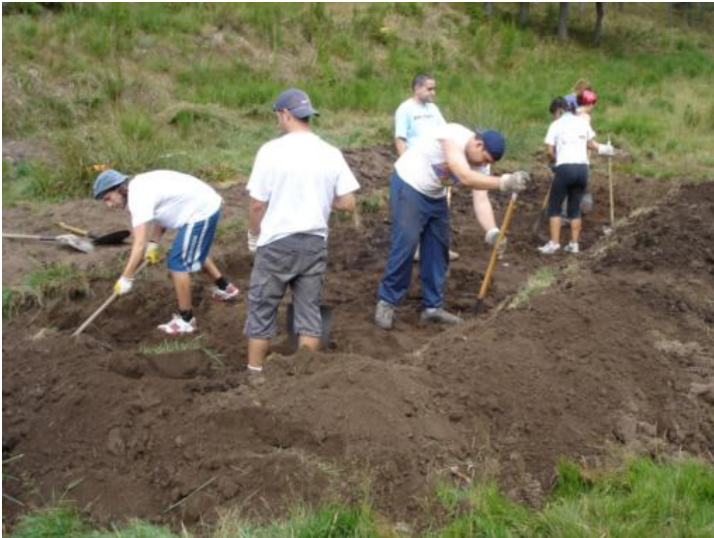
Excavación de la segunda balsa FMF para rebombeo y recreación de humedal natural con las aguas regeneradas