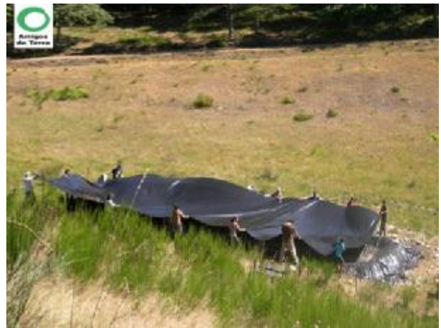
Solapamiento de Laminas