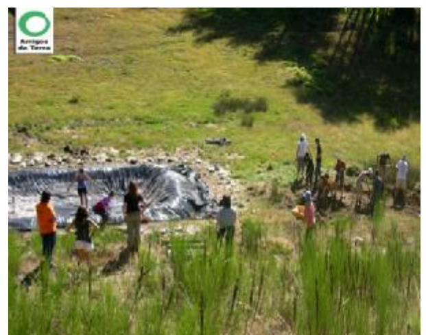
Estabilización exterior y decoración de taludes con rocas de la zona e inicio de excavación de segunda balsa de rebombeo