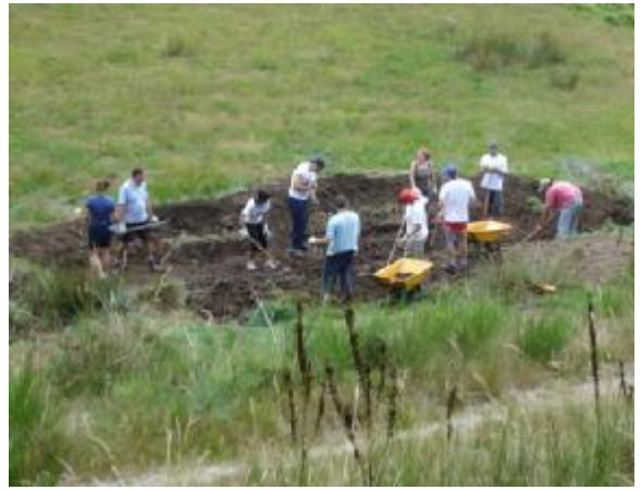
Excavaciones sobre replanteo primer día de trabajo